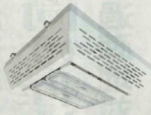
キャンピー灯GDHPシリーズ