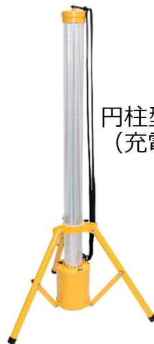
円柱型照明 (充電式)