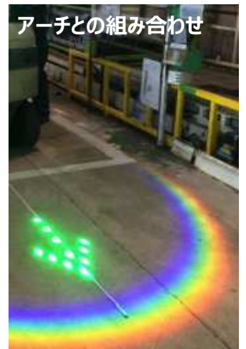
アーチとの組み合わせ