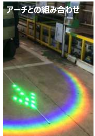
アーチとの組み合わせ