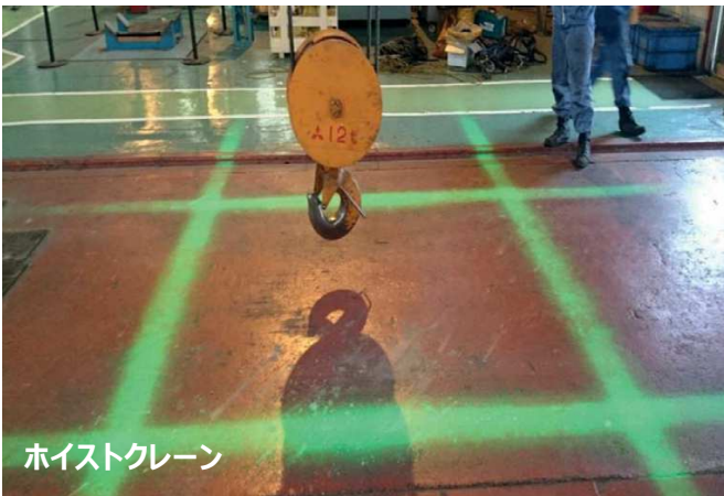
ホイストクレーン

視認性の高い直線状の光で危険ゾーンを可視化 動く吊り荷の真下を明示し作業者への注意喚起を促す 荷卸し場の位置決めや工場内の通路形成に活用できる