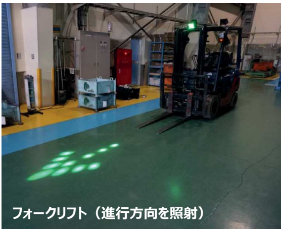
フォークリフト（進行方向を照射）

視認性の高い矢印の光で可動物の進行方向を可視化 フォークリフトやクレーンの接近を作業者へ知らせ注意喚起 車体前方に出る光は死角にいる作業者へ危険を知らせる