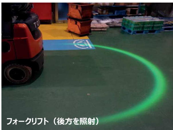
フォークリフト（後方を照射）

視認性の高い半円状の光で可動物の進行方向を可視化 可動物周囲の接近禁止ゾーンを明示し作業者へ注意喚起 危険区域を明示し人の立ち入りを防ぐ事故を未然に防止する